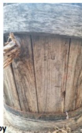
Pressoir sur roulettes,